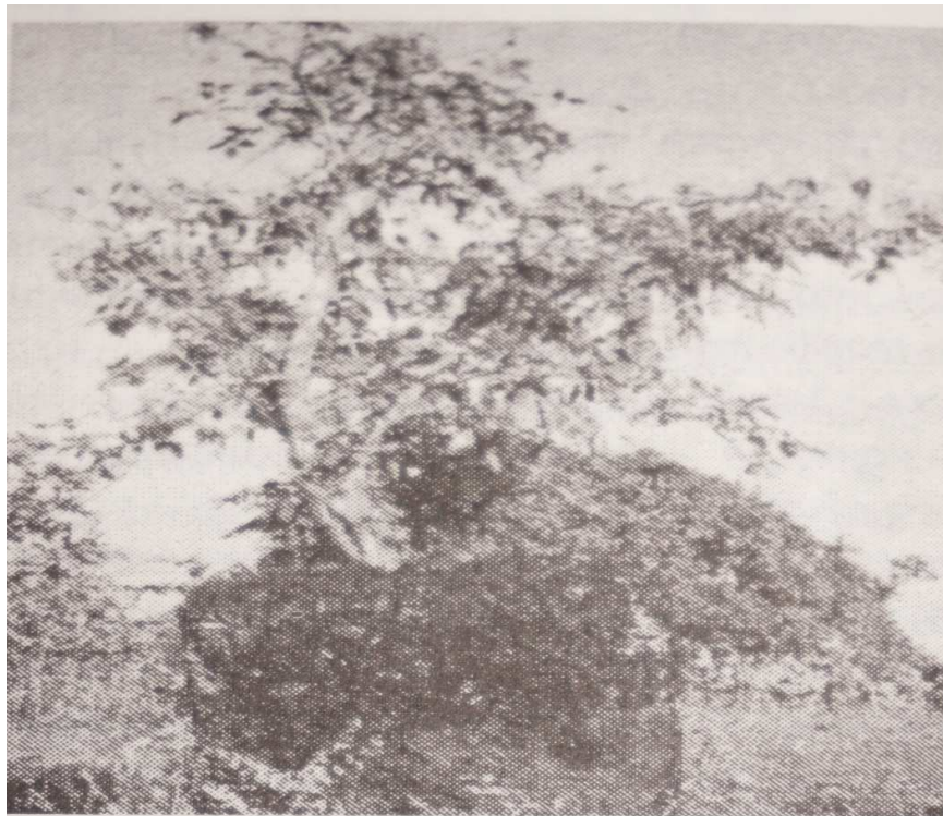
കണിയാൻകുന്ന് കല്വൃത്തം (കരിവെള്ളൂർ - പെരളം പഞ്ചായത്ത്)